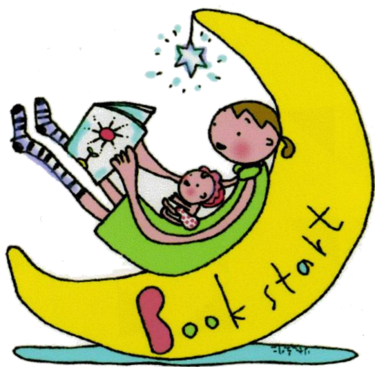
イラスト りたえりこ なめかわまい 鈴木麻紀子