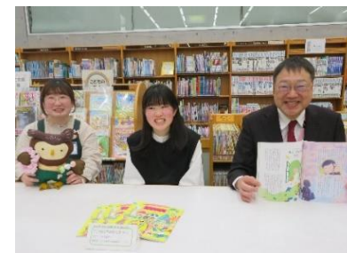
こどもとしょじつで前館長と一緒に