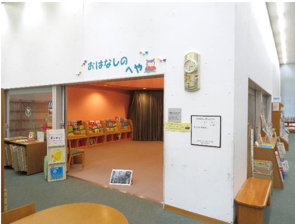
3 おはなしのへや全景