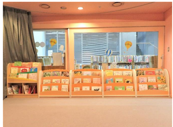
8 展示状況 (南側)