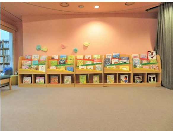
7 展示状況 (北側)