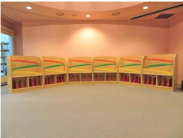
5 絵本ラック6台 (幅 90×高 100×奥 36cm)