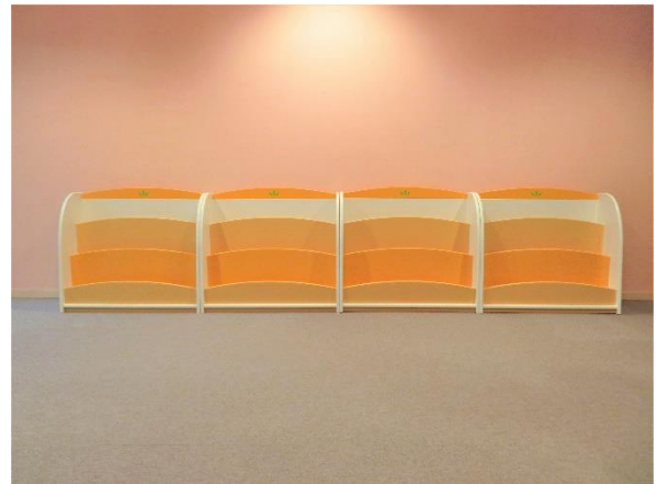
6 絵本立て4台 (幅 90×高 80×奥 35cm)