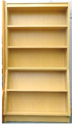
1 木製書架1台 (幅 93×高 170×奥 35cm)