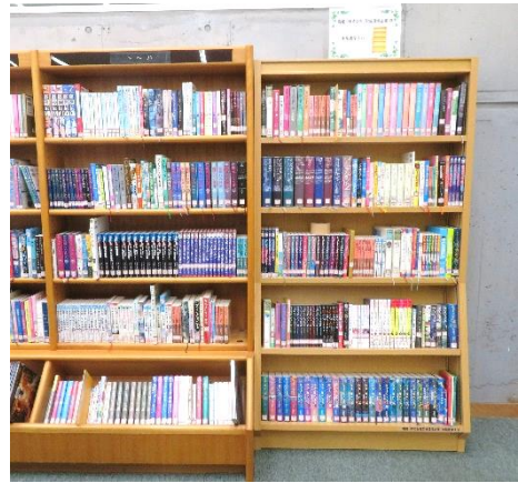
2 木製書架展示状況 (右側)